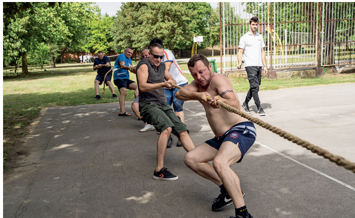
»Провера снаге и спретности: надвлачење конопца