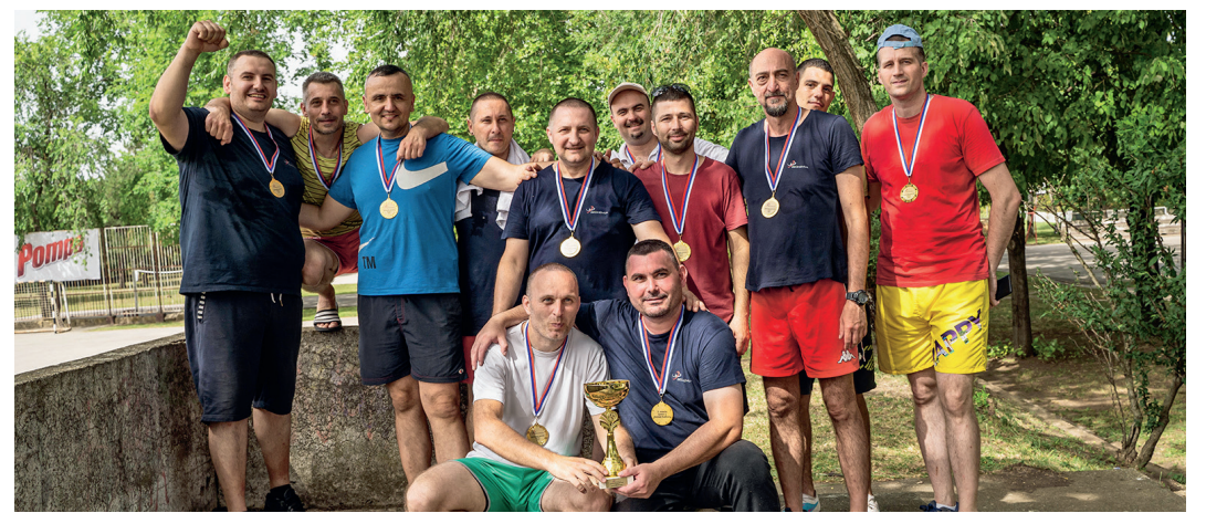
»Успешни такмичари награђени су медаљама и пехарима