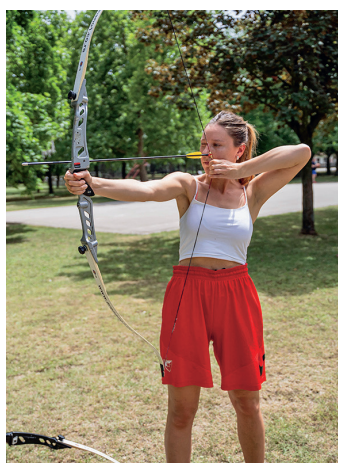
»Оштро око и прецизност