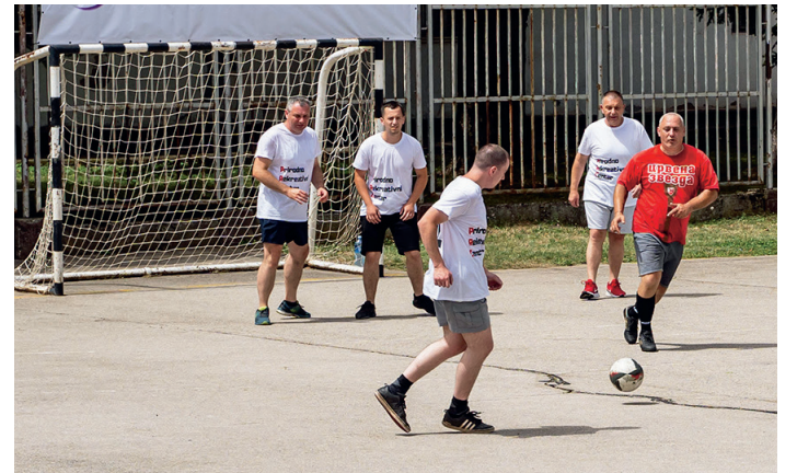
»Такмичење у малом фудбалу