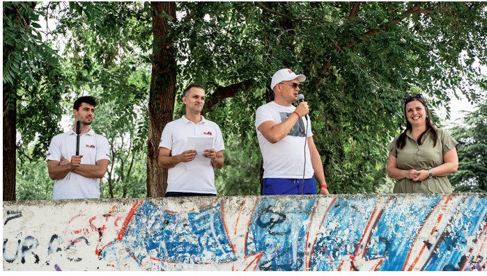
»Отварање спортских сусрета „Беохемије“

Такмичарски део обухватао је баскет и надвлачење конопца. Много више активности било је за оне који су желели да се рекреирају. Могли су да се одреде за стони фудбал, стреличарство, пикадо, одбојку, кукурузне рупе, набацивање обруча и бадминтон.