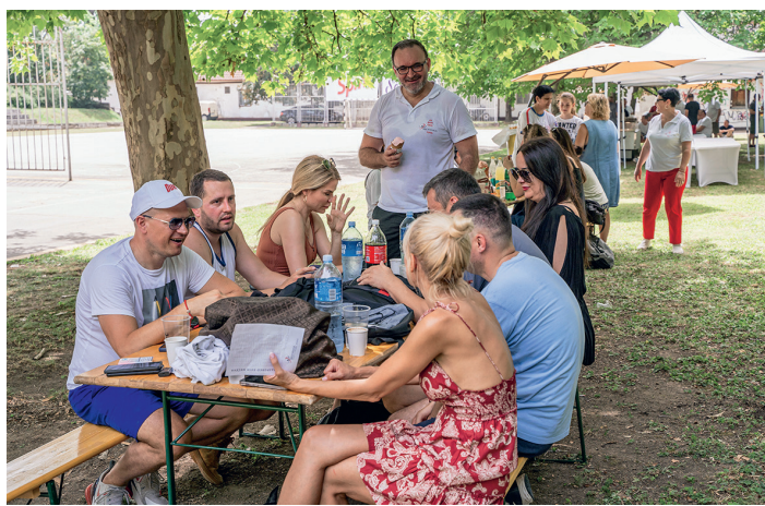
»Предах уз разговор и освежење